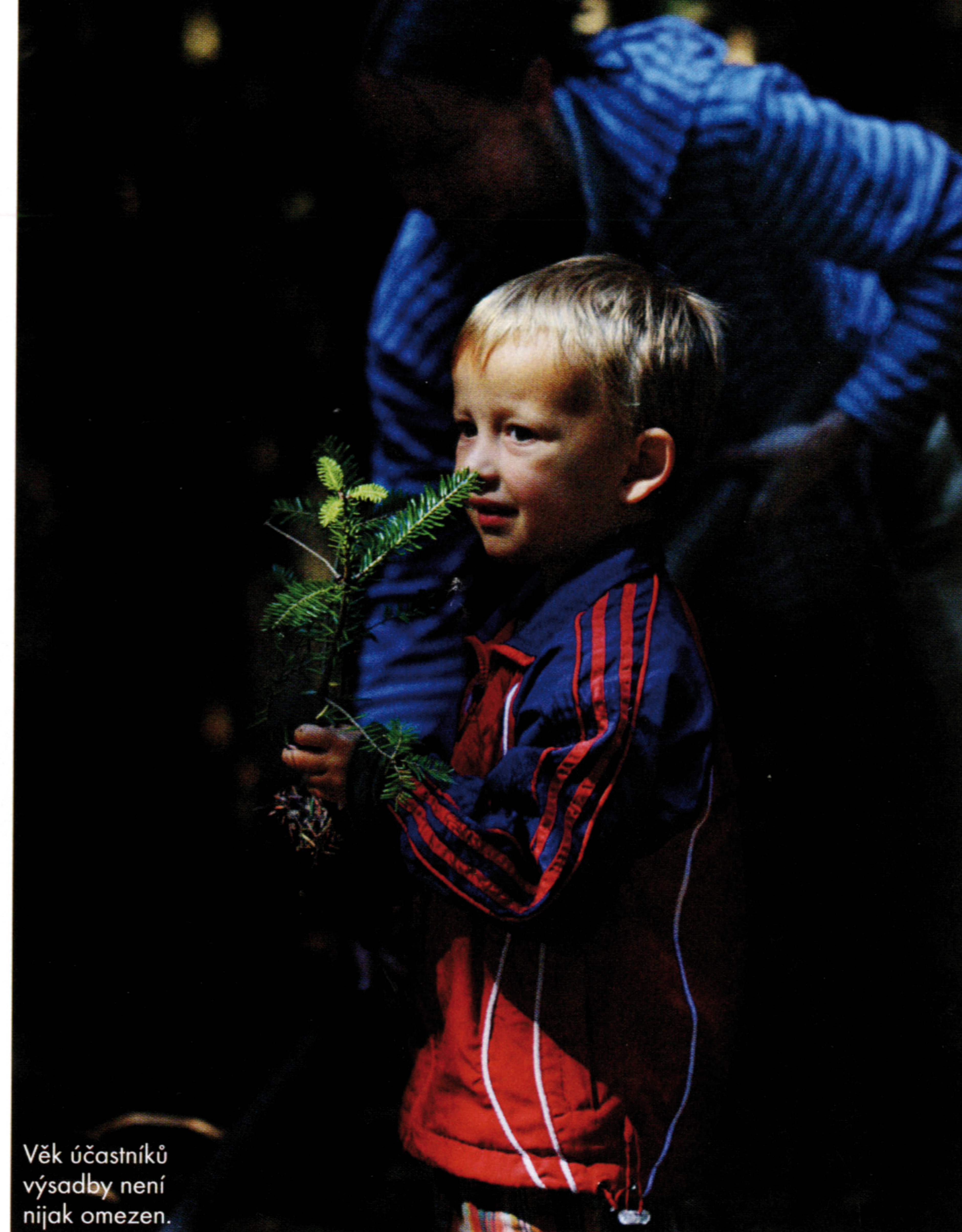
Věk účastníků výsadby není nijak omezen.